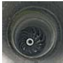
Die durchzuführende Reinigung erfolgt unter Verwendung spezieller Reinigungsgeräte.