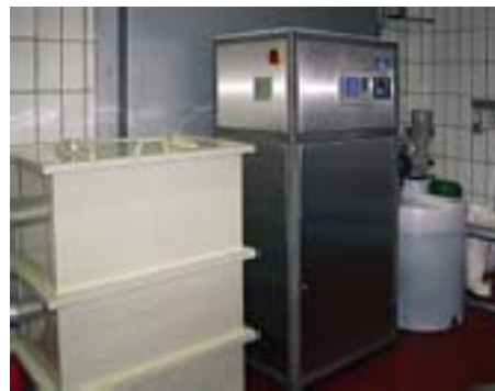
Strengsten Hygieneanforderungen gerecht werden

In Abstimmung mit unseren Kunden orientieren wir uns an Möglichkeiten, umwelt- und ressourcenschonende Betriebsstoffe einzusetzen und Entsorgungskosten zu reduzieren.