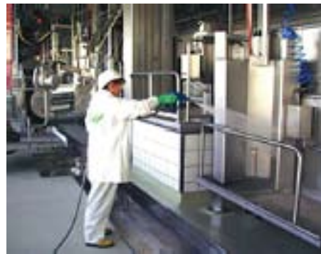
Professionelle Reinigung bis ins Detail

Wir sind uns der großen Verantwortung bewusst und garantieren unseren Auftraggebern die hierfür notwendige Professionalität.