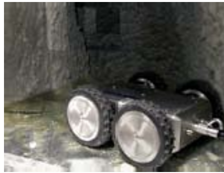
Mit Hilfe eines speziellen Kamerasystems werden Ab- und Zuluftkanäle filmtechnisch erfasst.

Optional lassen sich auch mikrobiologische Proben entnehmen.